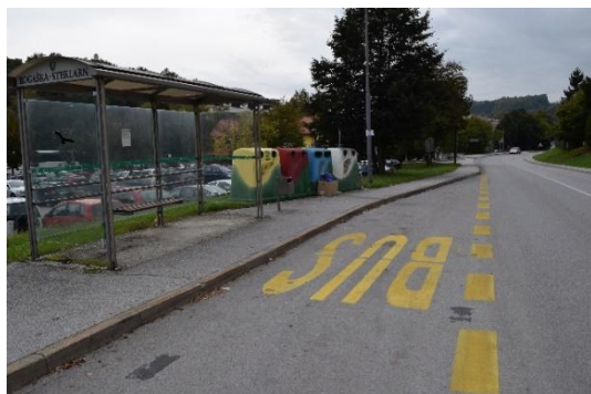
Postajališče - Steklarna