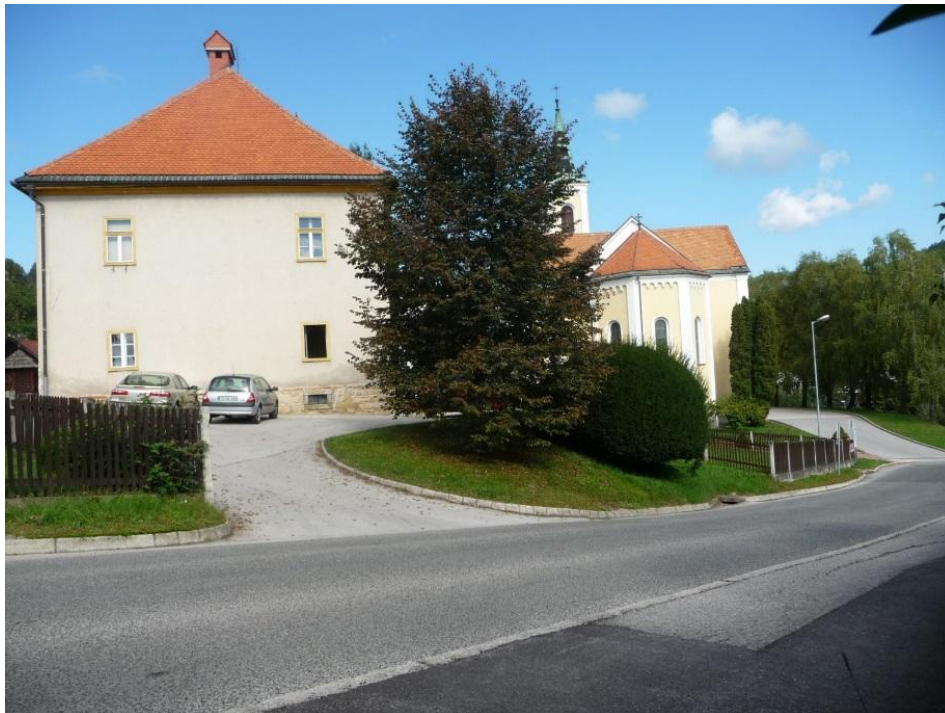
Brestovška cesta (izhod iz veroučne učilnice)

Ko učenci prihajajo iz veroučne učilnice, morajo prečkati cesto, da pridejo na pločnik. Prehod čez cesto je nevaren, saj ni prehoda za pešce.