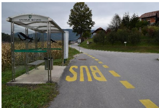
Postajališče Spodnje Sečovo