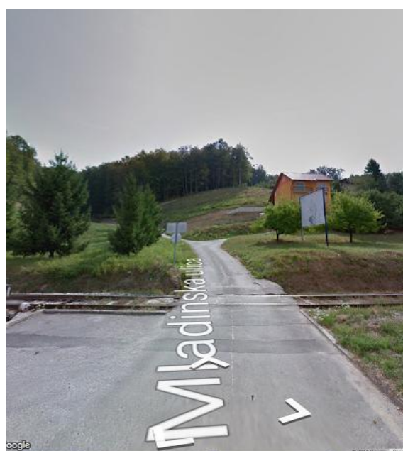
Prehoda čez železniško progov Tavčarjevi in Mladinski ulici

V Tavčarjevi ulici in Mladinski ulici učenci prečkajo prehod preko železniške proge, ki ni zavarovan z zapornicami ali polzapornicami.