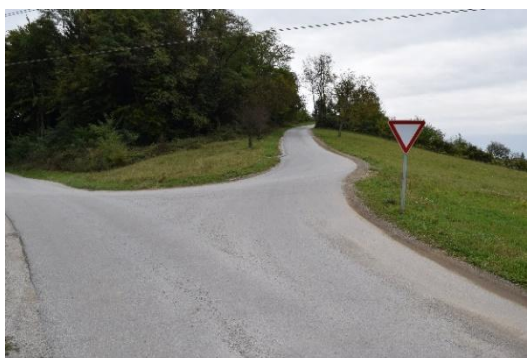
Postajališče Male Rodne