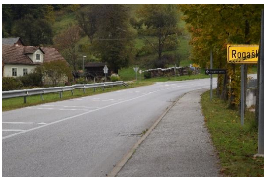
Postajališče Tržišče (odcep Sečovo)